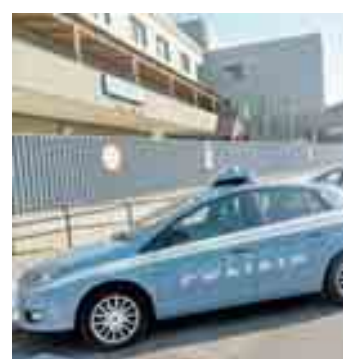
Il commissariato di Formia